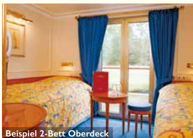
Beispiel 2-Bett Oberdeck